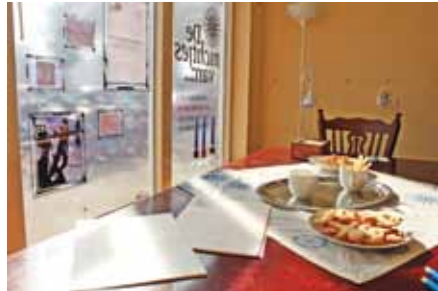
EEN SMAKELIJK TAFEREEL IN DE HUISKAMER VAN DE NICHTJES VAN...