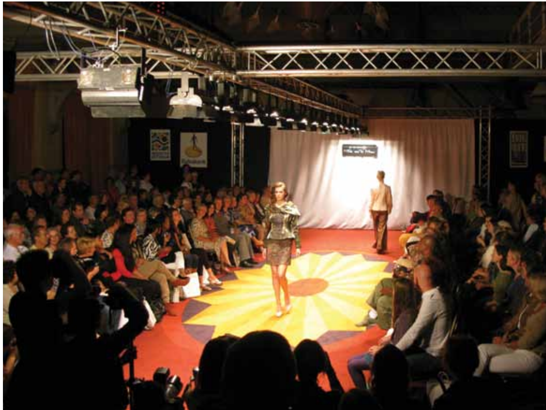
MODE AAN DE MAAS TIJDENS EXPEDITIE NOORDEREILAND