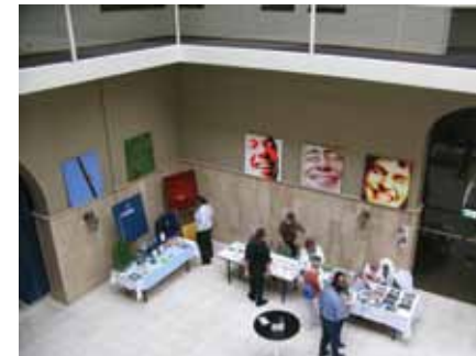
DE LACHENDE GEZICHTEN VAN KUNSTSCHILDER XXX

„Wat ik wil, is kinderen verleiden om op een andere manier naar de wereld en hun omgeving te kijken. Met fantasie. Hoe krijg je die fantasie aan de praat? Spelenderwijs! Doen, daar gaat het om. Je kunt het wel in een boekje opschrijven, al die wetenswaardigheden, maar daadwerkelijk naar buiten gaan en het zelf ontdekken, dat is wat kinderen het liefst doen.”