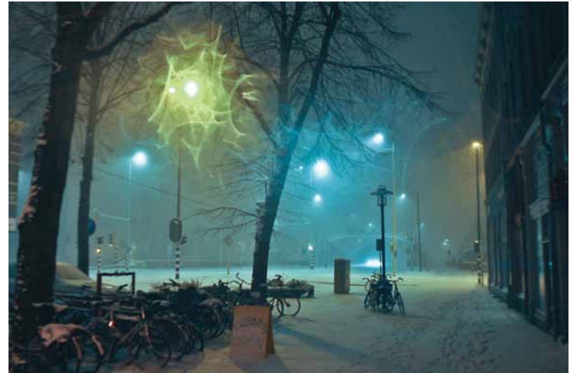
SNEEUW, FIETSEN EN KERSTVERLICHTING IN DE VAN DER TAKSTRAAT