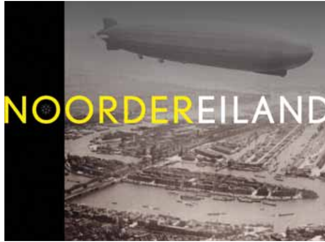
COVERBEELD VAN HET BOEK NOORDEREILAND DOOR ANNELIES VAN DER ZOUWEN EN BOUDEWIJN POTHOVEN