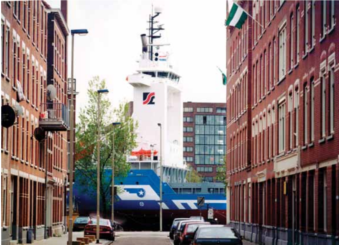
EEN VRACHTSCHIP LANGS DE PRINS HENDRIKKADE

Het Noordereiland is een inspirerende omgeving, waar de schepen praktisch langs de deur varen. En het was de thuishaven van de overleden fotograaf Ben Wind, wiens oeuvre in Photo Gallery Ben Wind getoond wordt.