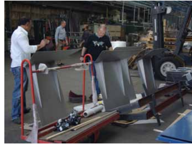
DE KALE PANORAMABORDEN IN DE CONSTRUCTIEFABRIEK

Na verbogen, gelast en gecoat te zijn in de constructiefabriek wachten de roestvrijstalen lessenaars in het atelier/gallery Maaskade 140 B op plaatsing op de kades. Ze zullen daar voorzien worden van panoramische fotos die aangeven welke gebouwen aan de wal/overkant te zien zijn en wie de architect is. Tevens valt er te lezen in welke tijdsperiode de bouw plaatsvond. De oudere Noordereilanders hebben dit allemaal zien gebeuren. Aan stuurboord en aan bakboord. Naar verwachting worden de rvs elementen in januari 2012 formeel met een feestelijke ommeganck in gebruik genomen, en hopelijk zal één en ander er toe bijdragen dat het toezicht op hygiëne, esthetiek en veiligheid op de kades werkelijk plaats gaat vinden. Aspecten waar zowel de op architectuur ingestelde bezoeker, bewoners en paatselijke ondernemers nu en in de toekomst baat bij kunnen hebben.