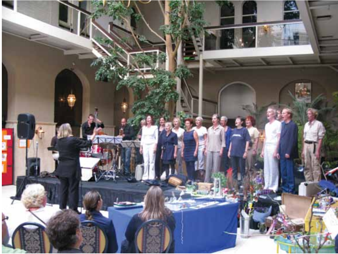
PUBLIEK EN KINDERKUNST OP DE UITVOERING VAN DE SCHEEPSOPERA IN HET HULSTKAMP GEBOUW