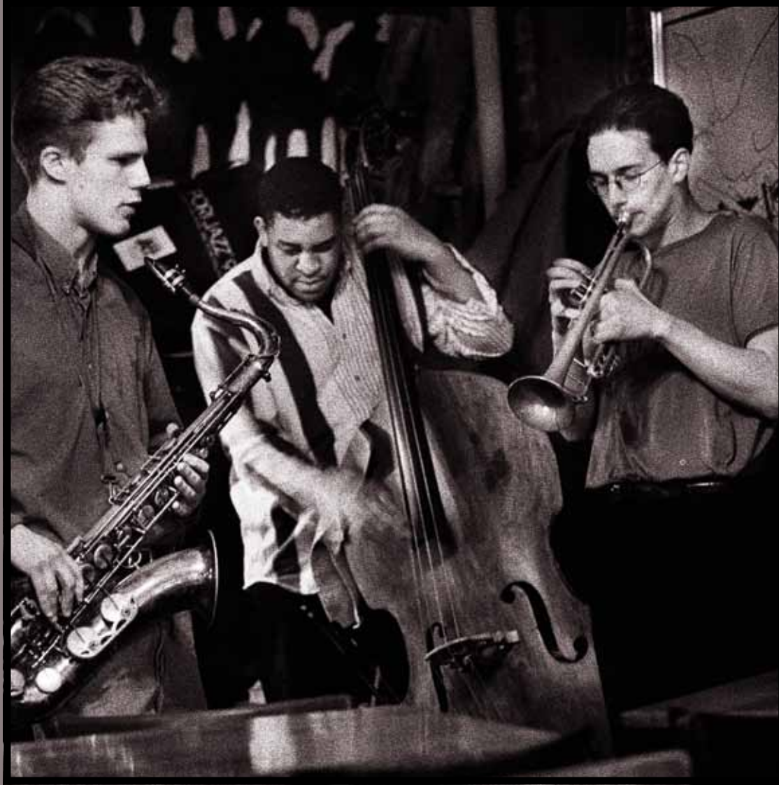
HET CULTURELE LEVEN