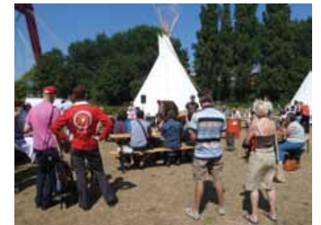
TIPI'S IN ONS PARK TER GELEGENHEID VAN KUNST KAMERS