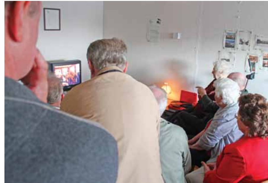
OUDE SCHIPPERS BEKIJKEN BEELDMATERIAAL UIT VEELAL VERVLOGEN TIJDEN OP EEN KLEUREN TEELEVISIE

Aan de Prins Hendrikkade verzamelt zich sinds vorig jaar het schippersgeheugen van het Noordereiland. In opdracht van de gemeentelijke dienst Kunst en Cultuur ontfermen Miranda en Eline van ontwerp bureau Knalrood (De nichtjes van...) zich over de rijke geschiedenis van de binnenvaart rond het eiland. Cultureel erfgoed dat verloren gaat, als niet de levende getuigen hun ervaringen met ons delen. Levende geschiedenis dus, opgetekend uit de monden van schippers zelf, of uit die van naasten. Oral history heet dat in de geschiedkunde. Foto's en verhalen van drie generaties binnenvaartschippers. Opmerkelijke verhalen, maar allemaal waargebeurd. En tijdens de diashow oude beelden die kreten van herkenning ontlokken aan de aanwezigen – „Kijk! Dat ben ik! Wat was ik nog mooi toen!”