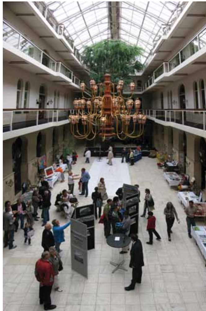
BEZOEKERS VAN EXPEDITIE NOORDEREILAND IN DE TOONZAAL VAN HET HULSTKAMP GEBOUW

De Klerk wil van het Noordereiland een aantrekkelijke bezienswaardige plek maken. Niet alleen voor Rotterdammers, voor mensen uit het hele land. Misschien zelfs van over de hele wereld. „Daarvoor zijn evenementen natuurlijk erg belangrijk. Daarmee speel je jezelf in de kijker. Maar wat mij betreft moet die aandacht een structureler karakter krijgen.